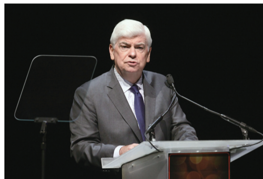
克里斯·多德