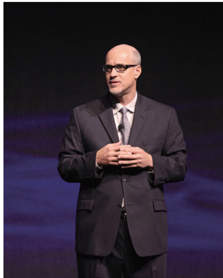
约翰·费连 摄影© Ryan Miller & Capture Imaging