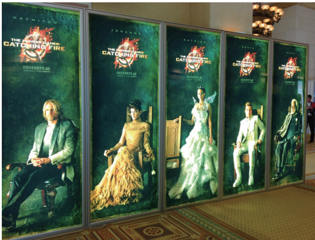
《饥饿游戏：起火》宣传海报